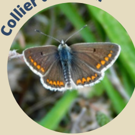
Collier de corail