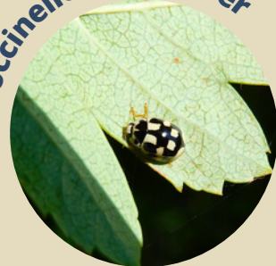
Coccinelle à échiquier