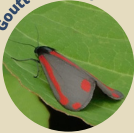
Goutte de sang