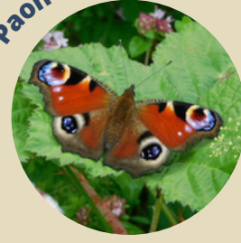
Paon du jour