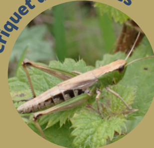
Criquet des pâtures