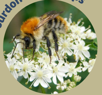
Bourdon des champs