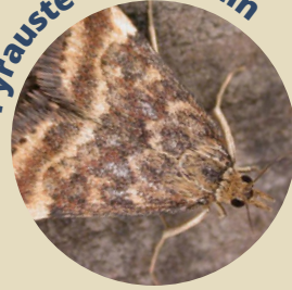
Pyrauste du plantain